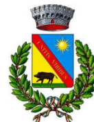
Comune di Urzulei